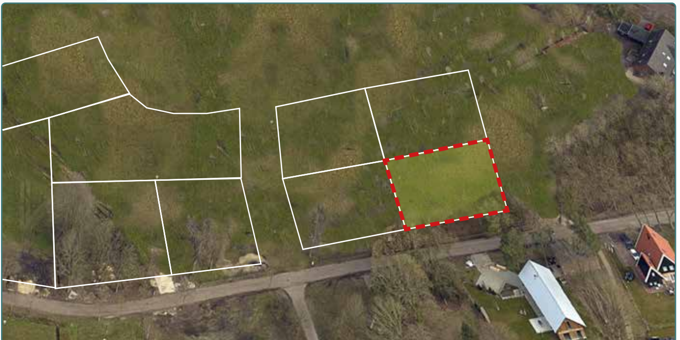
Kavel 157 vanuit de lucht