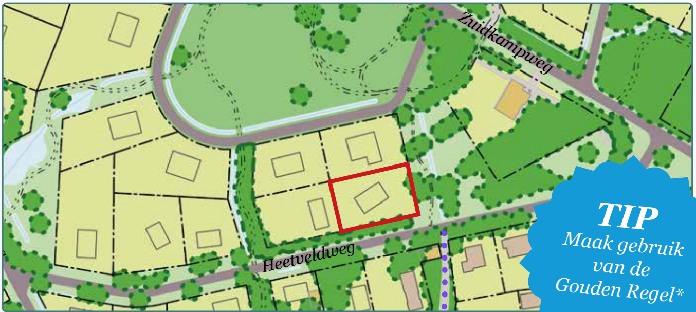
Situatietekening kavel 157